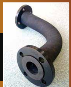
セラバンドホース ニップルレスタイプ