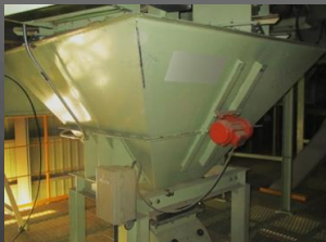
計量ホッパー使用例