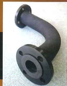
セラバンドホース ニップルレスタイプ