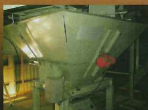
計量ホッパー使用例