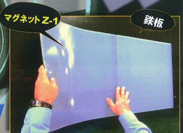
施工状況 (鉄板に直接貼り付け)